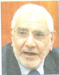
■ د. عبد المنعم ابو الفتوح